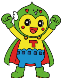
マスコットキャラクター ときぴー