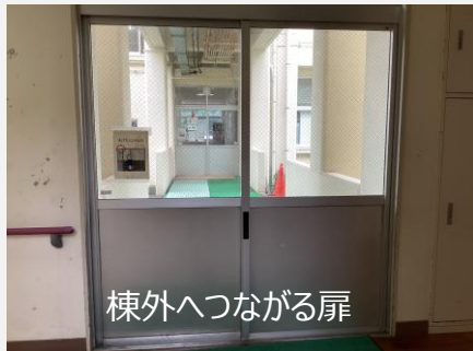
棟外へつながる扉