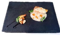
サーモンのムニエル きのこのデューセルソース