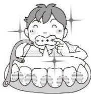
毛先が歯と歯の間に届くように、デンタルフロスも使おう