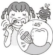
45°の角度であて、歯ぐきをマッサージするように