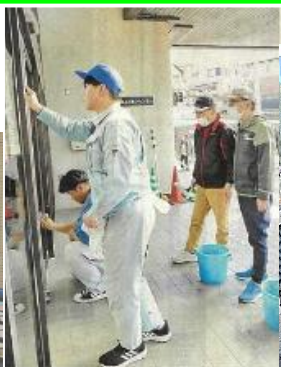
晴海台ふれあいセンター窓清掃 (R6.12.16 長崎新聞掲載)