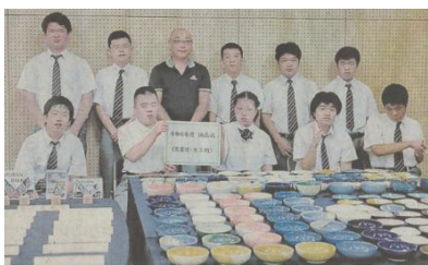
依頼の角打ち店主へ納品 (R6.9.14 長崎新聞掲載)