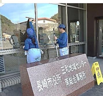
三和地域センター窓清掃 (R7.11.7NIBで放映)