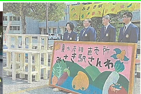
みさき駅さんわへ看板、のれん、商品陳列棚納品 (R8.3.28 長崎新聞掲載) (その他) NHK 長崎で放映、KTN で放映、毎日新聞掲載