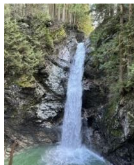
カスケードフォール

カナダでのホームステイは忘れられない経験になりました。カスケードフォールを見た時はあまりの壮さに驚きました。カナダの大自然に触れることができよかったです。また、UBCの学生と見学したキャンパスでは現地の学校生活に触れることができました。他にもホストファミリーとショッピングや日常生活を通して異文化を身近に感じました。この経験から、英語は人とつながるツールであることを意識して学んでいきたいと思いました。