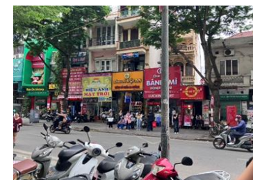
ベトナムの街並み

また、日本の当たり前が当たり前ではないことを知り、視野が広がりました。この経験をこれからの学校生活や将来に生かしていきたいです。