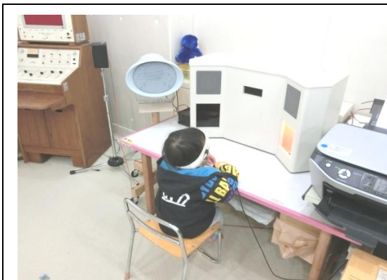
状態に応じた検査法を選択し、結果を積み重ねることで、聴力の確定を進めます。