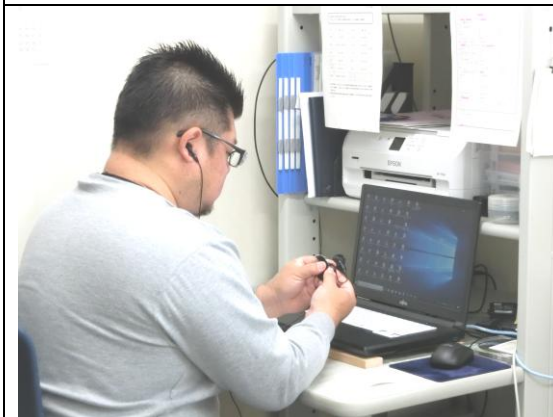
補聴器・人工内耳の簡易修理や必要な場合は補聴器の調整を実施します。