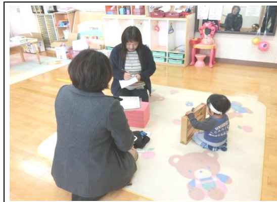
お子さんと関わりながらコミュニケーションのとり方を具体的にお伝えします。保護者の方の日頃の悩みについて、相談をお受けします。