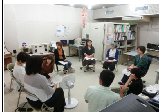
きこえやことばの発達、補聴器や人工内耳、子育て上の配慮などについてのお話をします。