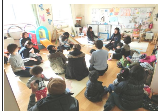
合同で、簡単な活動（制作・リズム遊びなど）をします。幼稚部と季節の合同活動も行います。