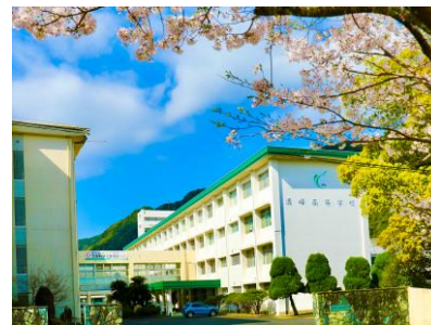
「佐々町の春」