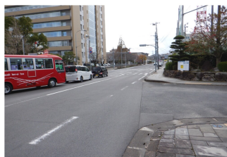
の区間での車の乗降禁止