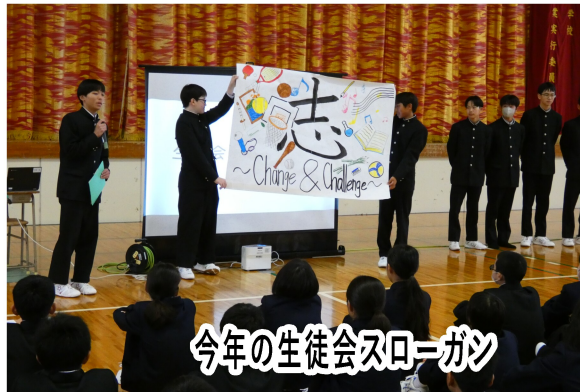
今年の生徒会スローガン