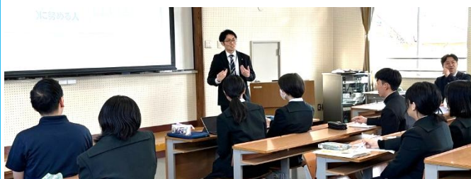
◇佐世保市教委 教職の魅力発信プロジェクト