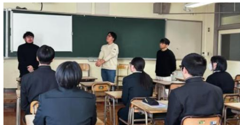
◇佐世保Design ～経営者と考える本気の未来～