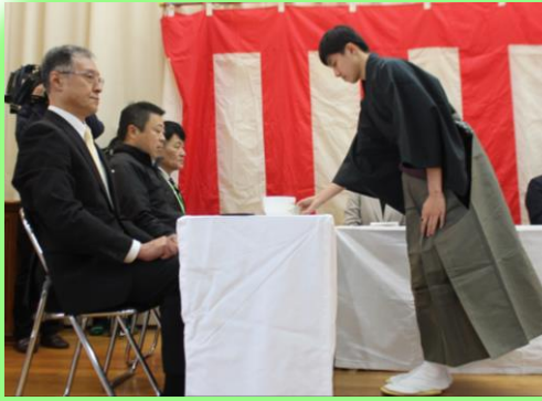
花びら餅が茶菓子として振舞 われました