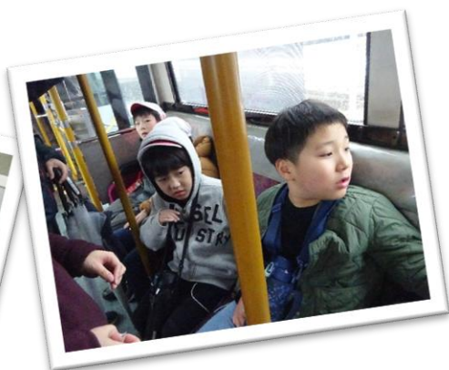
3年生「買い物をしよう」 バスの乗り方