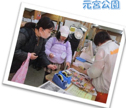
4年生「買い物をしよう」 さんわ みさき駅