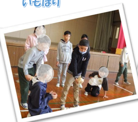
5年生「交流学習」 晴海台小学校