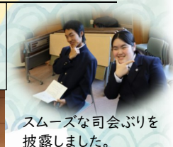
スムーズな司会ぶりを披露しました。