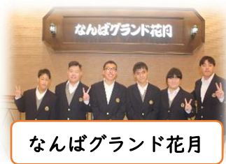
なんばグランド花月