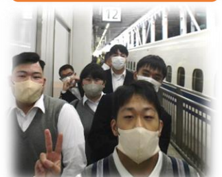
新幹線に乗って大阪へ！

生の漫才などを観覧したり、夕食にお好み焼きを食べたりして、初日の疲れが吹き飛びました。