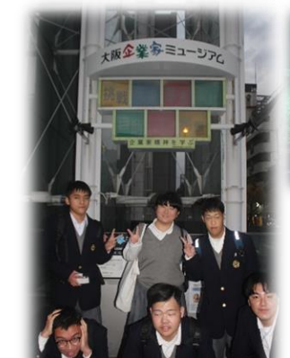
大阪企業家ミュージアム