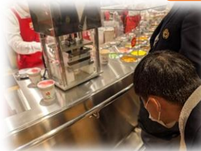
カップヌードルミュージアム