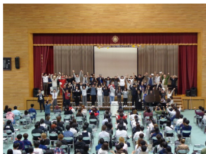
〈『手のひらを太陽に』の大合唱〉

体育大会が終了したばかりの、限られた時間の中で準備がとても大変だったと思います。しかし生徒のみなさんや先生方が一丸となり、それぞれの想いを紡いでゆくことにより、中央祭の大成功という1本の太い糸が完成したのではないかと思います。今後もこの中央祭で学んだことを学校生活の様々な場で活かし、三課程が一致団結してよりよい佐世保中央高校を築いてゆくことを願っています。