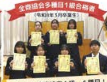
全商協会多項目1級合格者 (令和8年3月卒業生)