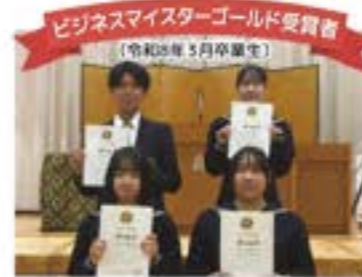
ビジネスマスターゴールド受賞者 (令和8年3月卒業生)