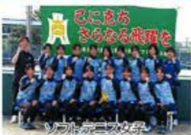
ソフトテニス女子