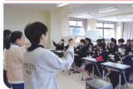
絵本読み聞かせ教室