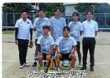
ソフトテニス男子