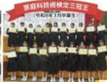
家庭科技術検定三冠王 (令和8年3月卒業生)