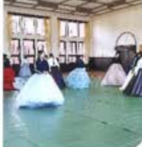
ウォーキング講座