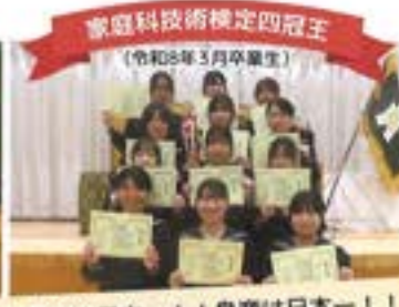
家庭科技術検定四冠王 (令和8年3月卒業生)