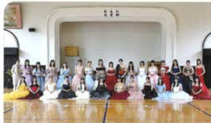
3年 課題研究 ドレス作り

「家庭科」に関する専門的知識や技術を習得し、実践的な活動を通して、食物、被服、保育、福祉等の生活産業にかかわるリーダーとして地域社会に貢献できる生徒を育成します。