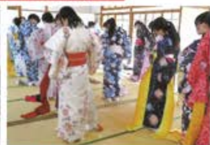
ゆかた着付け教室