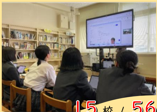
15校 / 56校