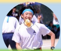
中高合同体育祭 中高心の教育講演会 小中高合同海浜清掃 小中高合同持久走大会 小中高合同歓迎遠足