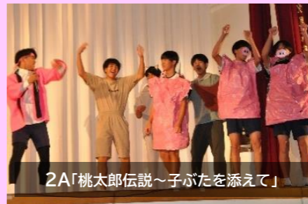
2A「桃太郎伝説~子ぶたを添えて」