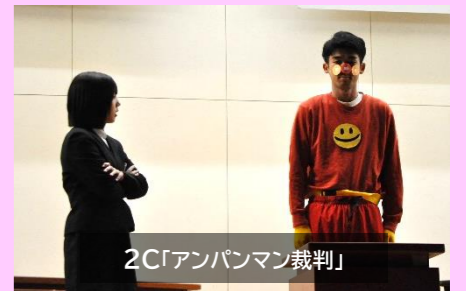
2C「アンパンマン裁判」