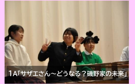
1A「サザエさん~どうなる?磯野家の未来」