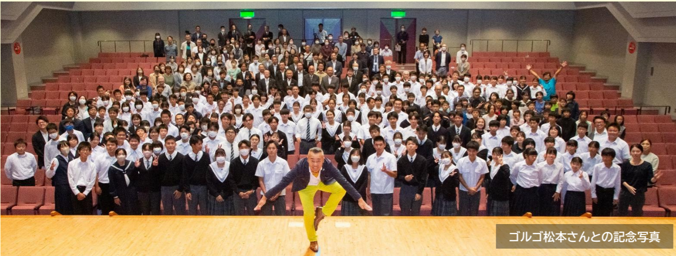
ゴルゴ松本さんとの記念写真