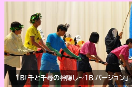
1B「千と千尋の神隠し~1Bバージョン」