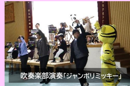
吹奏楽部演奏「ジャンボリミッキー」