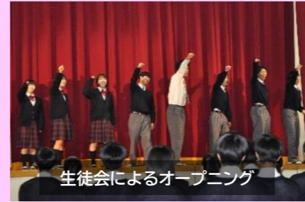
生徒会によるオープニング

今後は70周年、その先の100周年に向けてさらに上高をパワーアップさせていきましょう！