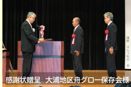
感謝状贈呈 大浦地区舟グロ-保存会様