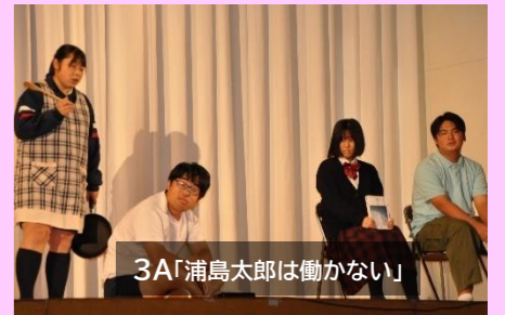
3A「浦島太郎は働かない」