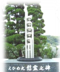
宇和島水産高校内 「えひめ丸慰霊之碑」