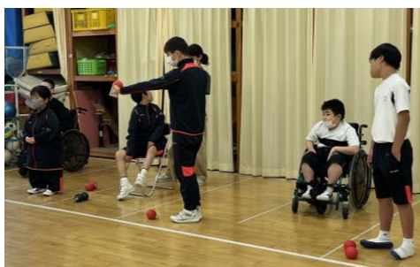
日頃の部活動の様子

2021年に本格的な活動をスタートし、現在、高等部3人、中学部5人の計8人で活動しています。顧問は5人です。部門や学部が異なる仲間と協力しながらボッチャという競技を通して、競技力の向上はもちろんのこと、日々の生活を豊かにしたり、コミュニケーション力を高めたりすることを目標に、毎週木曜日15:10~16:00にわかす棟1Fプレイルームで活動を行っています。見学はいつでも大歓迎です。ご希望の方は学校にご連絡ください。