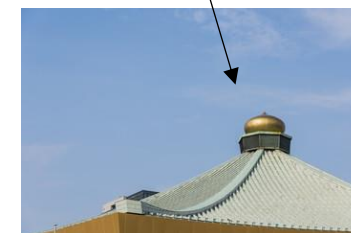
日本武道館の偽宝珠(ぎぼし)