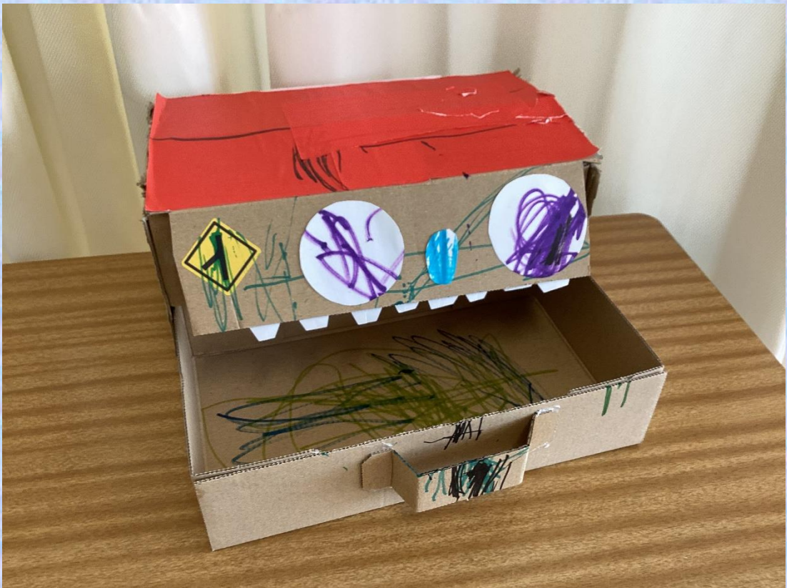
「かいじゅうのおもしろ BOX」 小4 F・M