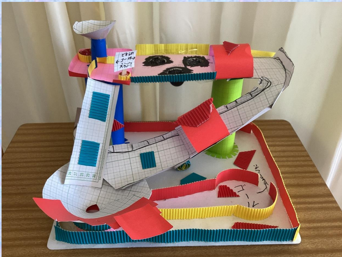
「ころころガーレ」 小4 B・D