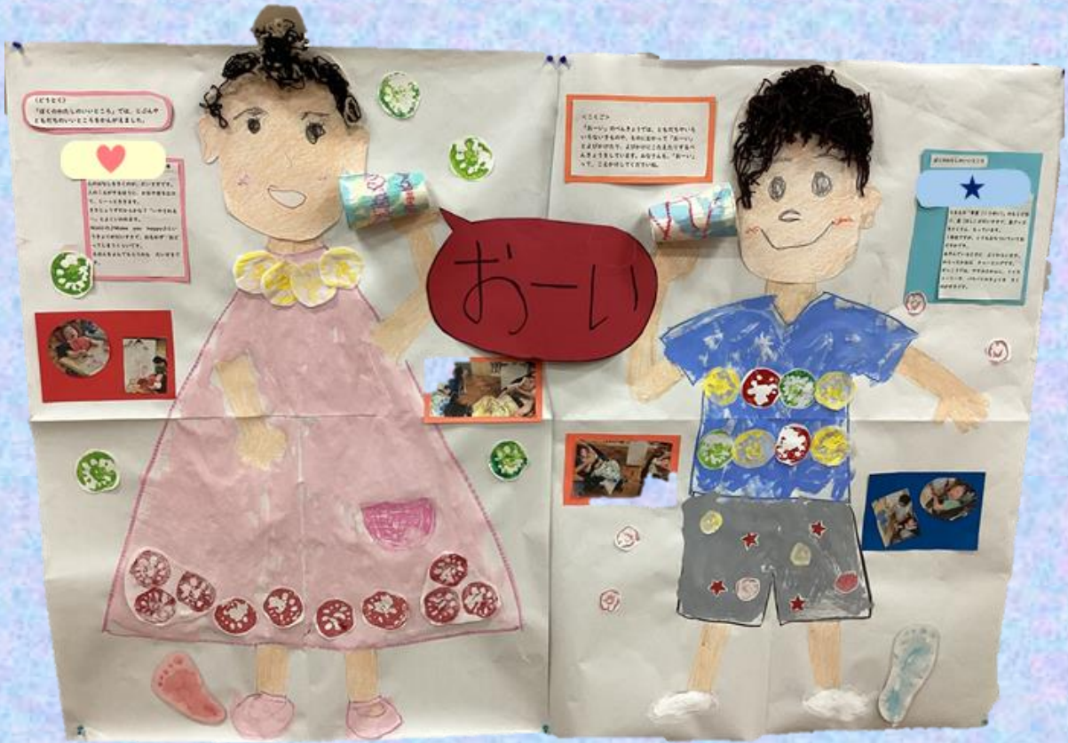
「ぼくのわたしのいいところ」 小1 I・K、小3 M・Y