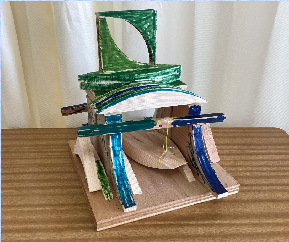
「森の家」 小4 B・D