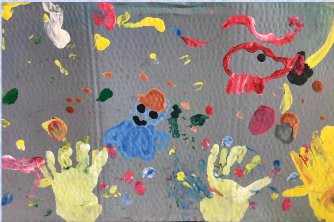
「カラフル水族館」 小2 B・L