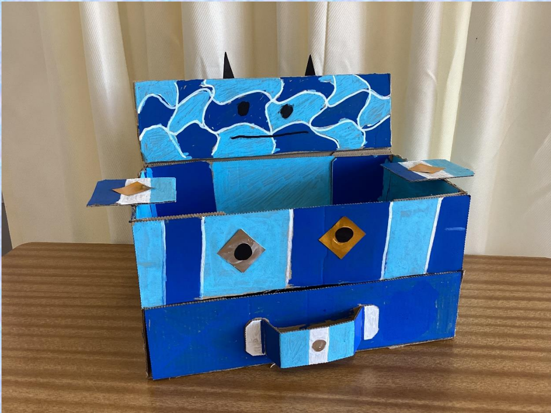
「おもしろ BOX」 小4 B・D