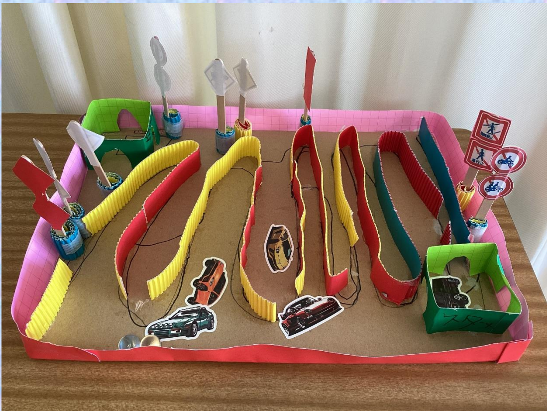
「山みち」 小4 F・M