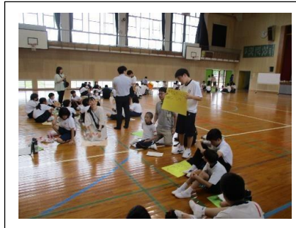
グループごとの自己紹介タイム