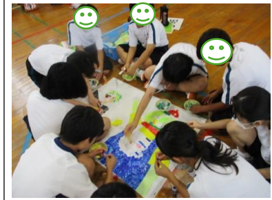
東彼杵中学校が考えた制作活動