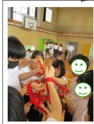
川棚特支の生徒が考えたレクリエーション②「人間知恵の輪」