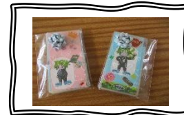
最後にしよりのプレゼントをいただきました。