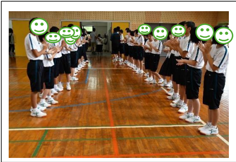
東彼杵中学校に到着。体育館入口に並んで待っていてくれました。

グループに分かれて、自己紹介をしたり、それぞれの学校で考えたレクリエーションをしたりして交流を深めました。同じグループ同士で協力して、一つの作品を完成させたり、知恵の輪を解いたり、積極的に交流ができました。帰りのバスの中では、生徒から「楽しかった～」という感想が聞かれました。