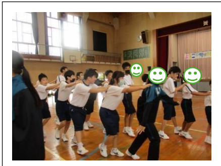
川棚特支の生徒が考えたレクリエーション①「じゃんけん列車」