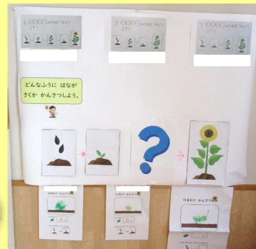
ひまわりの成長を予想したよ。