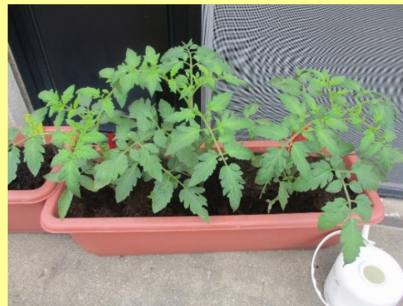
ミニトマトもぐんぐん成長中！