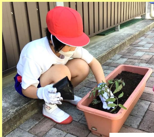
ミニトマトの苗植え