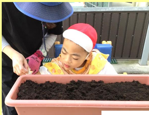
ひまわりのたねまき

2 年生では、生活科「季節を感じよう」で学習した夏の花の「ひまわり」と夏の野菜の「ミニトマト」を植えました。これからどのように成長していくのかを観察していきます！