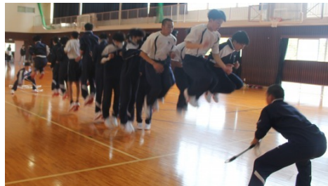
《長縄大会》 息を合わせる楽しさを知る