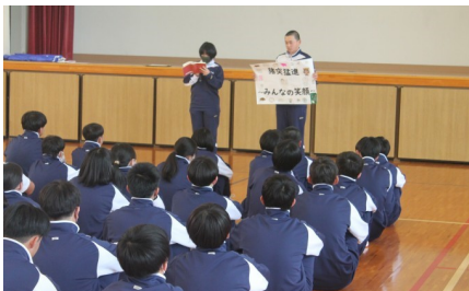
《クラス目標発表》 他クラスを知る