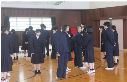
《自己紹介》 クラスの仲間を知る