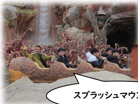
スプラッシュマウンテン