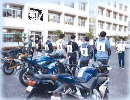
二輪車安全実技指導