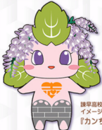
諫早高校・附属中学校 イメージキャラクター 『カンちゃん』