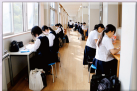
早朝の自主勉強（職員室前 AM7:00～）