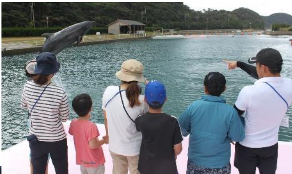
←イルカの餌やり体験をしたり、イルカのトレーニングを間近で見たりしました。餌やりは怖がっていましたが、イルカにあげることができました。