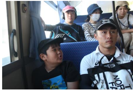
↑バスの中から見える景色を楽しそうに見ていました。

小学部では、10月19日(木)に1・2年生は「イルカパーク」に校外学習に行きました。4年生と5年生の児童は、一緒にイルカパークに行き、そのまま「出会いの村」で宿泊をしてきました。