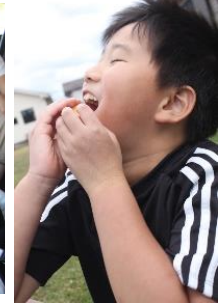
↑みんなでお弁当を食べました。おいしく食べました!