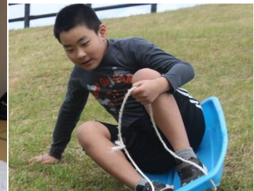
オリエンテーリングは、猿岩まで行きました。お風呂、着替え、就寝の準備など、できることは自分でしました。初めての泊まりでしたが、消灯するとぐっすり寝ることができました。楽しみにしていた「シーカヤック体験」は、残念ながら天候不良で中止になりましたが、草スキーをして楽しみました。