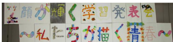
会場に掲げた学習発表会テーマ

10月29日(日)に学習発表会を行いました。 「笑顔が輝く学習発表会～私たちが描く青春～」が、 児童生徒が掲げた今年の学習発表会のテーマでした。