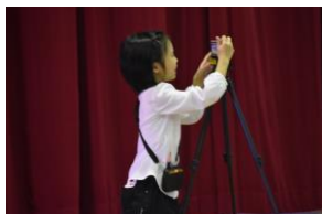
写真屋さんになって「パシャ」

小学部は「われらいさはや探検隊」の題で発表しました。1・2年生は生活科で「まち(町)たんけん」の学習をしました。諫早駅周辺の交番や八百屋さん、お茶屋さんや写真屋さんに出掛けて、あらかじめ用意した質問をしたりお店の方の話を聞いたりして、知らないことをたくさん勉強しました。特に、写真屋さんでの出来事が印象的で、劇にして台詞も動きもしっかりと覚えて堂々と発表できました。