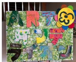
ART ダンデライオン (看板)

この他、美術や図工などで制作した作品の展示も行い、たくさんの皆様に興味深く御覧いただきました。