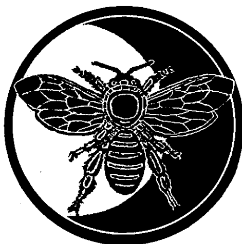
【五高定のシンボルマーク】