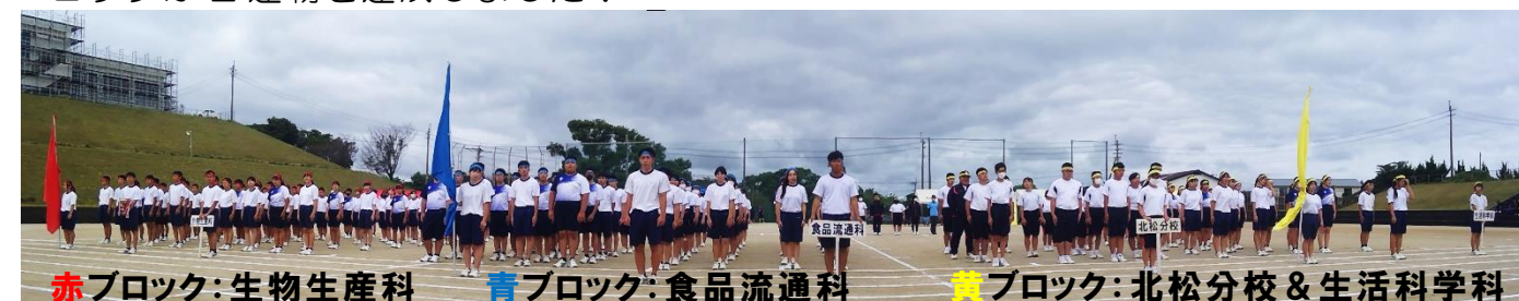
赤ブロック:生物生産科

お知らせ 11月19日(日)第75回農業文化祭(一般販売 9:30~13:30)が開催されます♪ 皆様のご来場心よりお待ちしております！