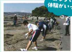
島ならではの体験がいっぱい!