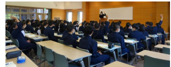
《上級生による講話の様子》

保護者等の皆様、お子様が高校を卒業する際により良い進路希望を実現できますように、これまでと変わらぬ温かいご支援をどうぞよろしくお祈りいたします。