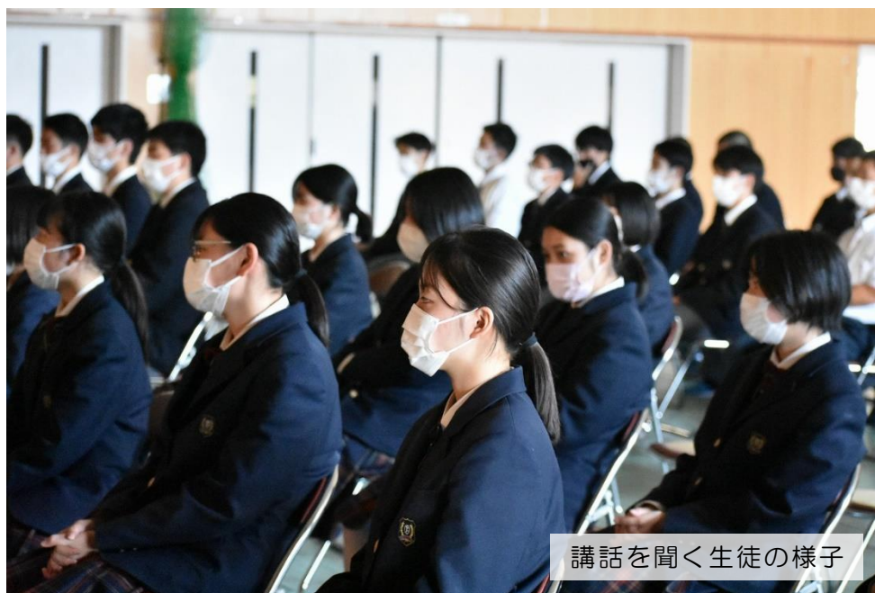
講話を聞く生徒の様子