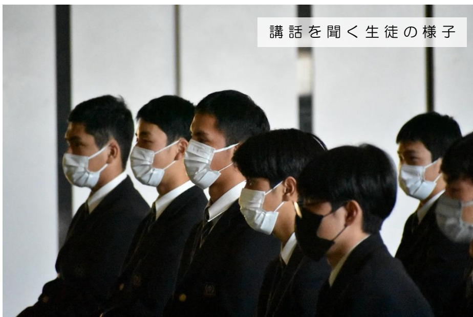
講話を聞く生徒の様子