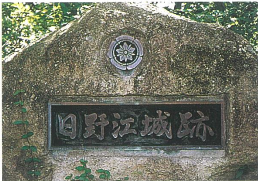
有馬家の紋章顕彰碑（日野江城・本丸跡）