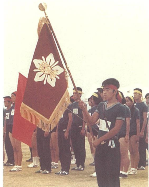
校旗披露 (49. 10. 13)