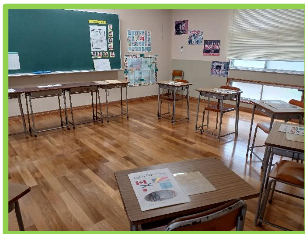
潮 騒 寮 に て