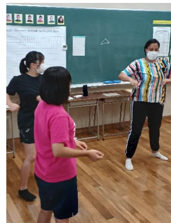
<ダンスや英語の歌でウォームアップ!>

ヒントから質問文を作ってみよう! 想像力を働かせ、ヒントをどのように使うかによってたくさんの質問を作ることができました。 明日の異文化体験の活動でたくさん質問するぞ!