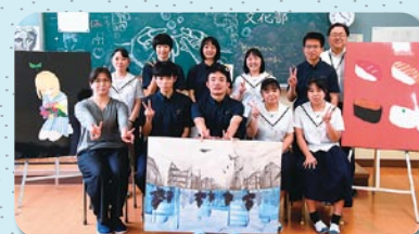
総合文化部(美術班)