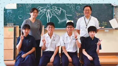
総合文化部(放送班)