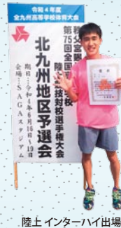
陸上インターハイ出場