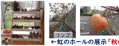
←虹のホールの展示「秋の木の実」