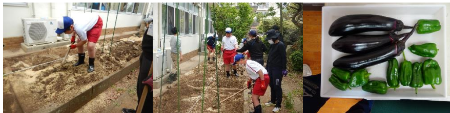
農業は畑の耕起からしました！