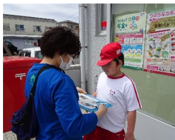
警察署や郵便局などを見ました！

小学部では、「いろいろなお仕事」という学習を通して、身近な公共施設で働く人たちの仕事について学びます。今回は、新型コロナウイルス感染症予防のため、施設内の見学をしたり、働く方にお話を伺ったりすることはできませんでしたが、警察署や郵便局などの建物を見たり、学校で消火の模擬体験をしたりと、制限のある中で最大限の学習活動を設定して取り組みました。2学期には、中学部の作業体験を予定しています。