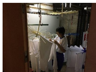
壱岐ステラコート大安閣