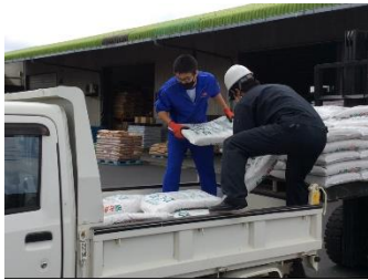
壱岐市農業協同組合