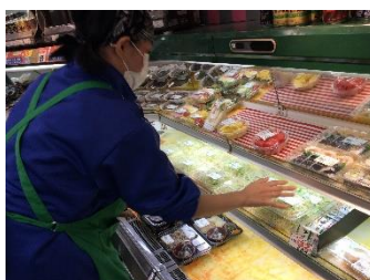
株式会社 ヤマグチ