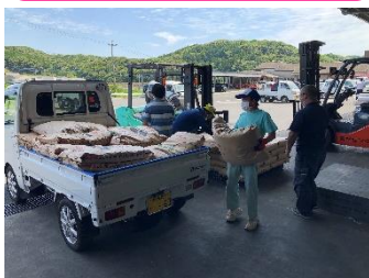
壱岐市農業協同組合