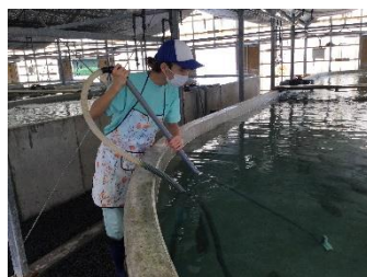
株式会社 なかはら