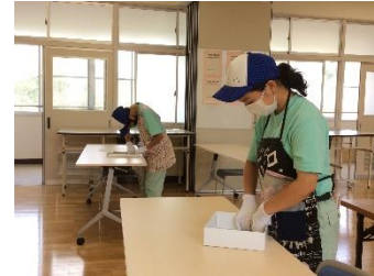
箱折り(大塚製菓堂)