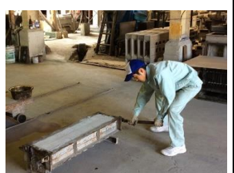
株式会社 オーカワ