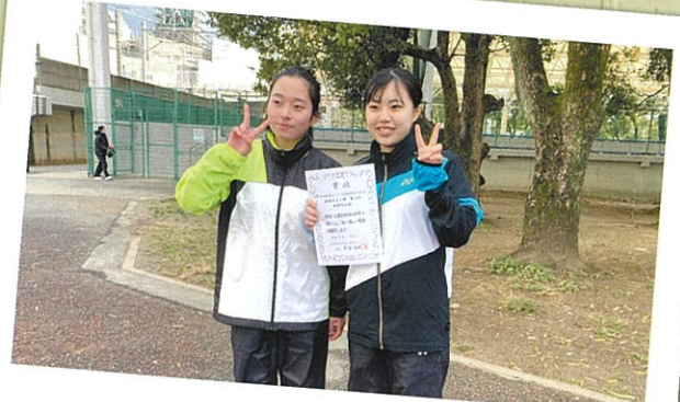
ソフトテニス部 (女子)