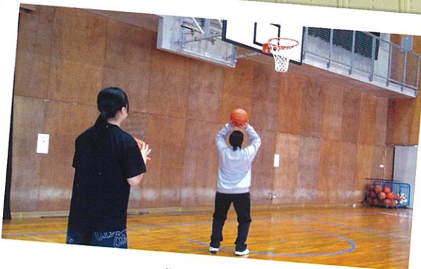
バスケットボール部 (女子)