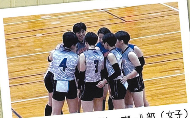
バレーボール部 (女子)