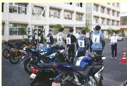
二輪車安全実技指導