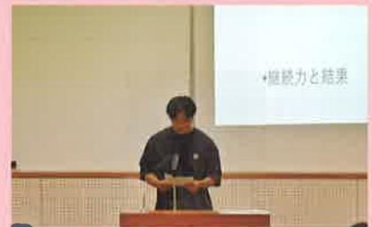
7月 校内生活体験発表