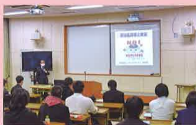
12月 薬物乱用防止講話