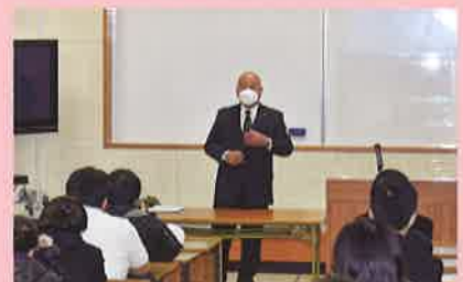
11月 人生の達人セミナー