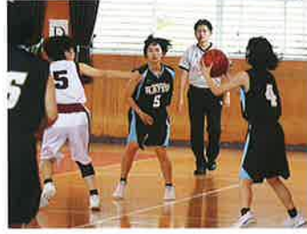
バスケットボール (女)