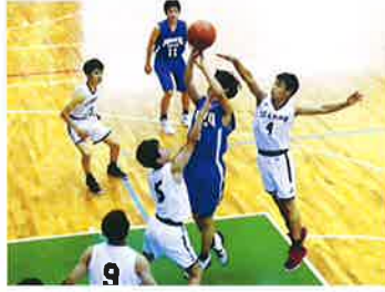
バスケットボール (男)