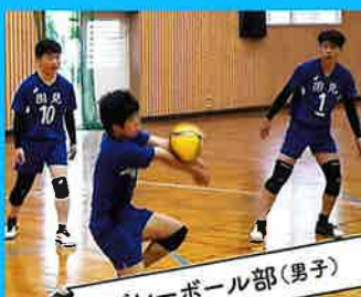
バレーボール部(男子)