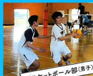
バスケットボール部(男子)