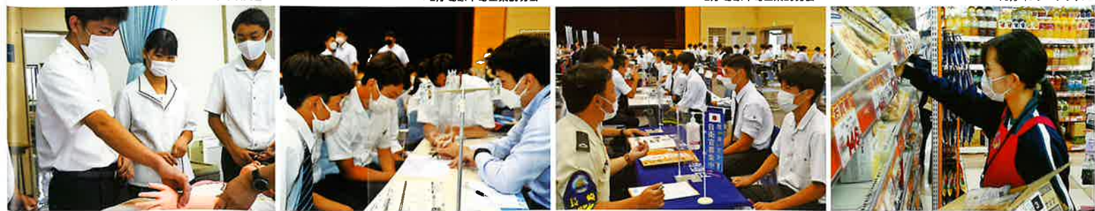
▼10月 インターンシップ