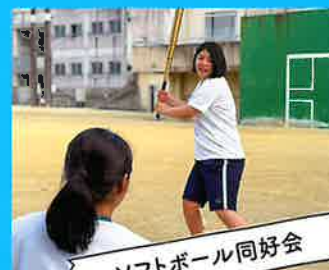
ソフトボール同好会