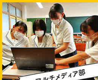
マルチメディア部