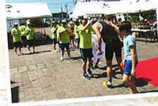
パラモンキングボランティア