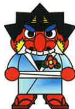
海陽マスコットキャラクター「もんた君」