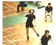
バドミントン女子