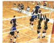
バレーボール女子