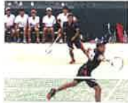
ソフトテニス男子