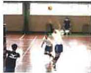
バレーボール男子