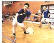
バドミントン男子