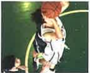
バスケットボール男子