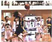
バスケットボール女子