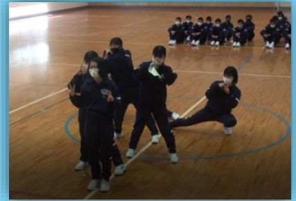
団体整列 ハイポーズ！