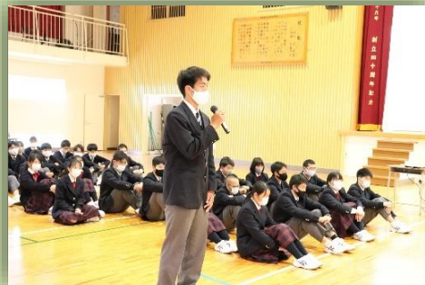
歓迎のあいさつをする生徒会長