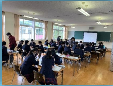
クラス目標検討中