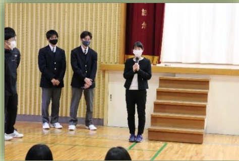
紹介される大村先生