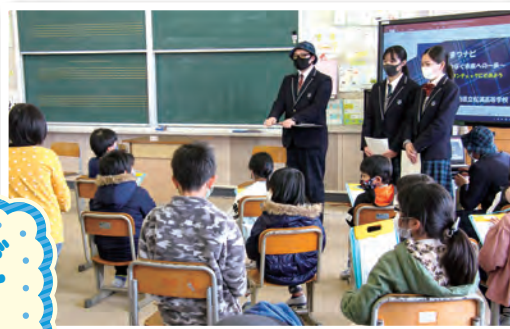
今福小学校の児童と共に学習