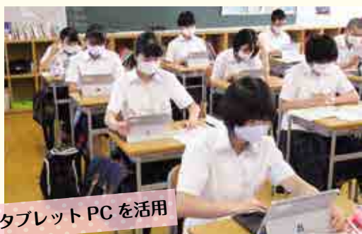
タブレットPCを活用