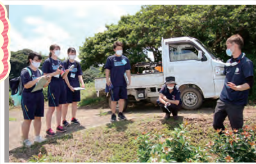
フィールドワーク