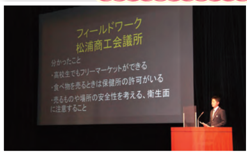
ゆめホールでの課題研究発表会